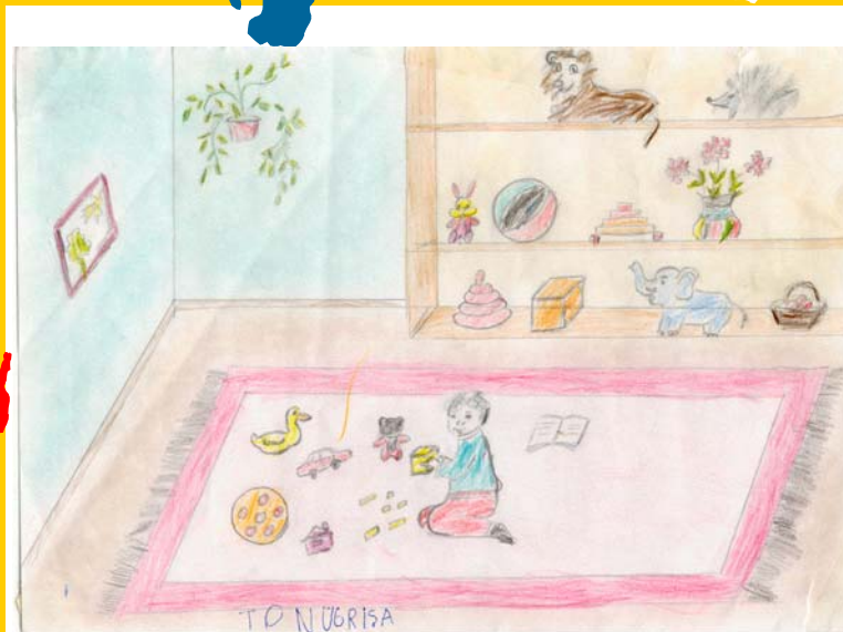
Tonu Grișa, 5 ani.